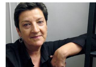
Nekane SAN MIGUEL BERGARETXE

Magistrada de la Audiencia Provincial de Bizkaia.