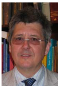
Manuel MORENO PUEYO

Magistrado de la Sala 4ª del Tribunal Supremo.