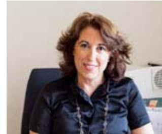
Gema TOMÁS MARTÍNEZ

Magistrada de la Sala 4ª del Tribunal Supremo.