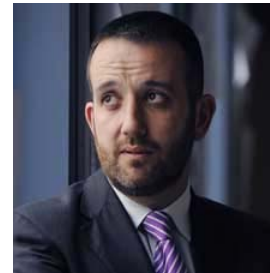
Aner URIARTE CODÓN

Magistrado de la Sala de lo Civil del Tribunal Supremo.