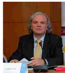
Gonzalo PUEYO PUENTE

Magistrado del Juzgado de lo Mercantil nº 1 de Oviedo.